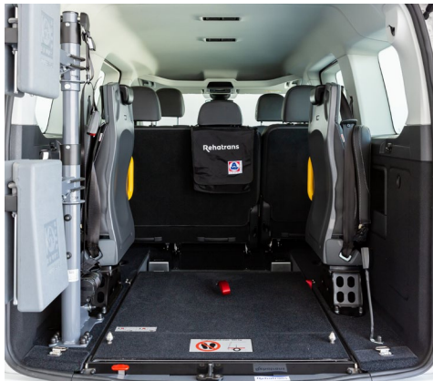
Su sistema EASYFLEX permite abatir la rampa y aprovechar el maletero.