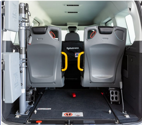
Asientos opcionales en tercera fila, para cuando no viaja el pasajero en silla de ruedas.