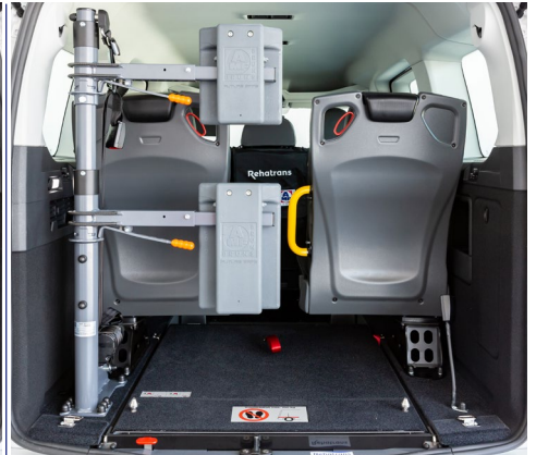
Opcionalmente, se puede equipar el vehículo con un respaldo y reposacabezas FUTURESAFE .