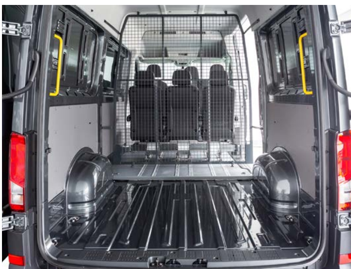
Configuración con una fila de asientos. Gran espacio de carga.