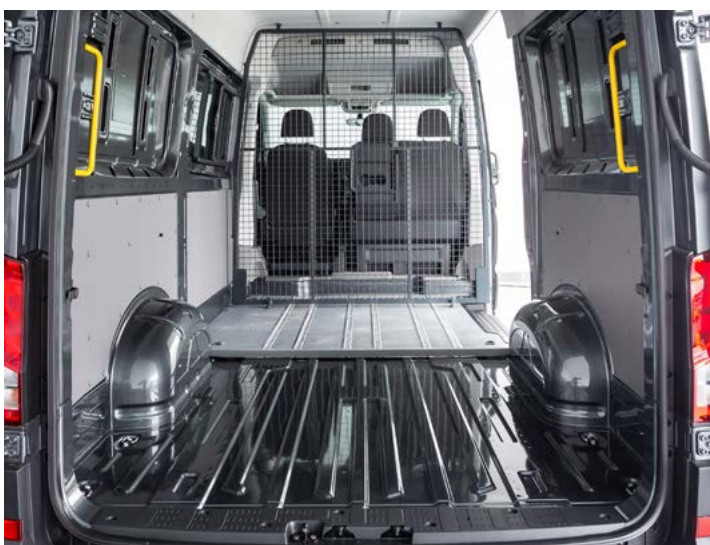
Asientos desmontables quick fix. Rejilla en posición para capacidad máxima de carga.