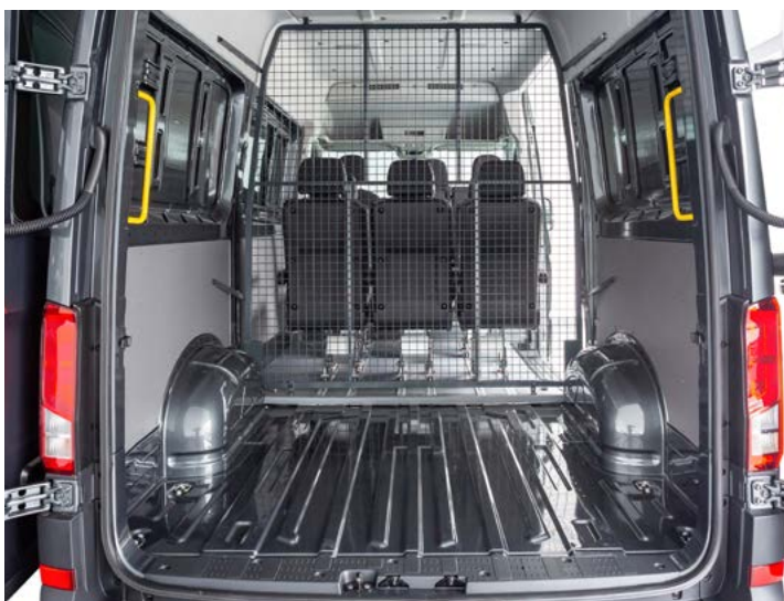
Configuración de dos filas de asientos (solo disponible para L4 y L5)