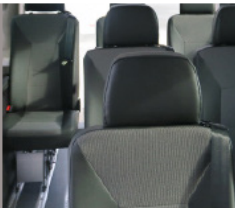
Confortable, seguro y asientos Smartseat ISOFIX, reposabrazos derecho y tapicería Volkswagen mixta.