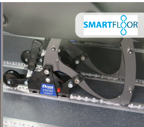
La fijación patentada de liberación rápida M1 es fácil, segura y flexible. Con ruedas que facilitan la movilidad de los asientos