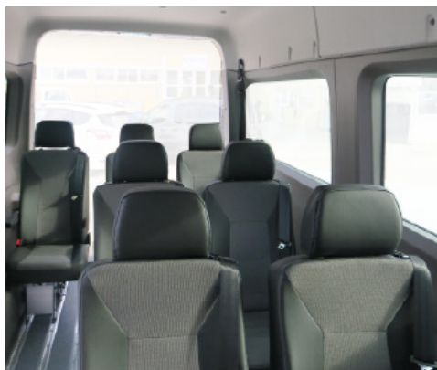
Opcional: Revestimiento deluxe, con guarnecidos Trims